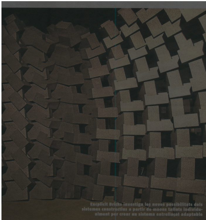
Explicit Bricks investiga les noves possibilitats dels sistemes constructius a partir de maons tallats individualment per crear un sistema entrellaçat adaptable